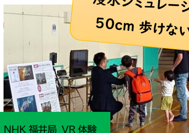
NHK 福井局 VR 体験