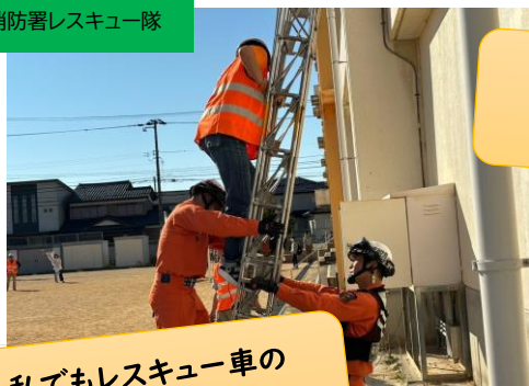
中消防署レスキュー隊

松本小グラウンド・体育館で、炊き出しモーニングや地震・水害VR、アマチュア無線など、防災に関する様々なコンテンツを体感していただきました。