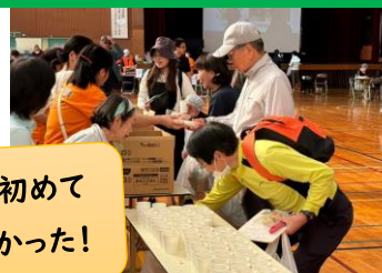
女性防火クラブ等地区有志で炊き出しモーニング